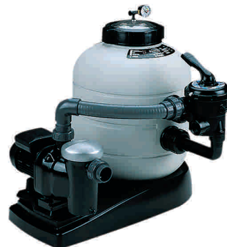
Monobloc Top Top-mount monobloc